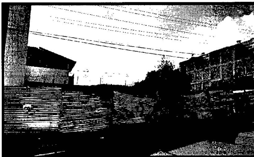
Ilustración 4. Imagen proyecto Edificio Vasarely

Fuente: Foto tomada durante visita de inspección el 28/02/2024