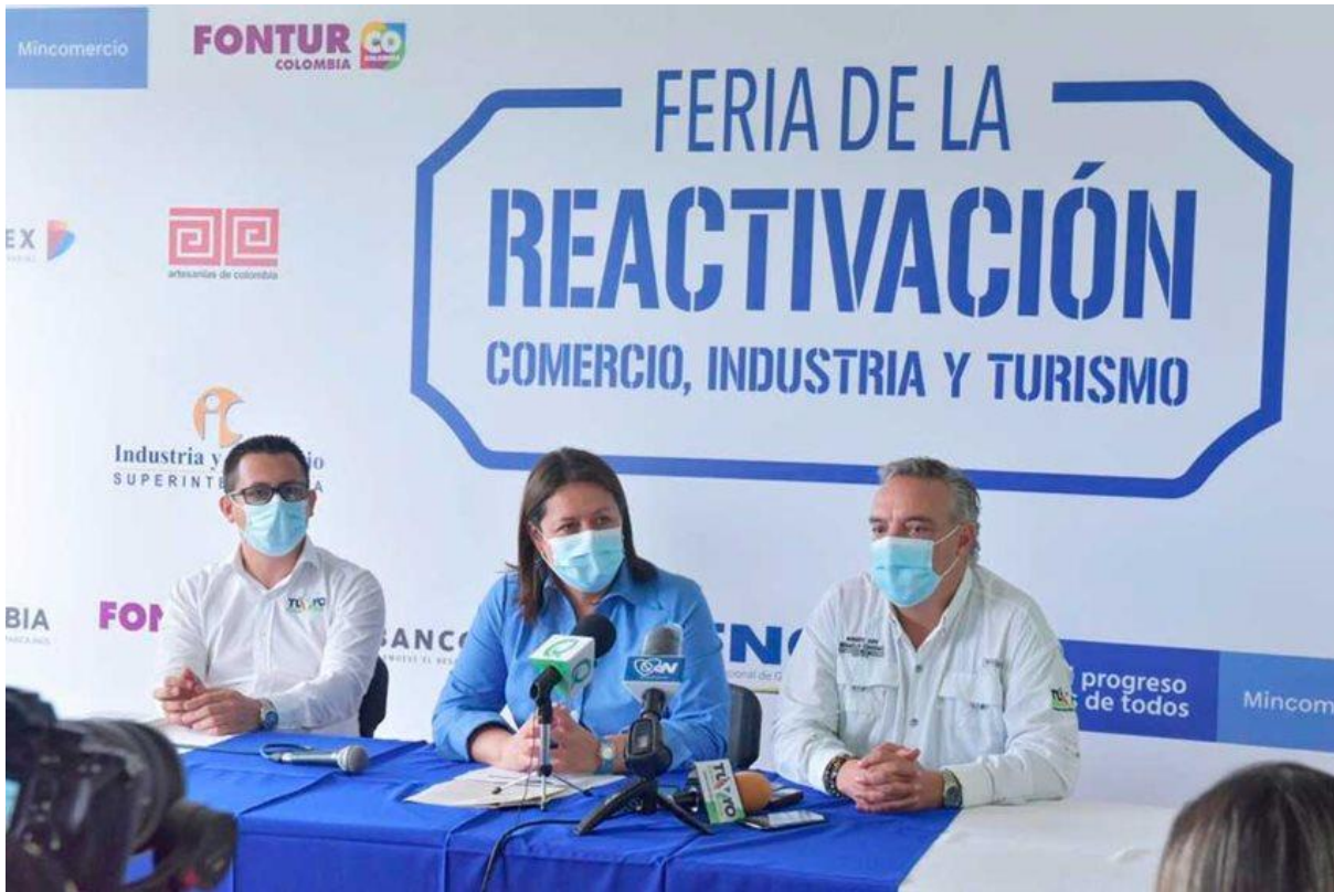
Pie de foto: entre los retos más importantes de la región está la reactivación del turismo.

En el certamen se hicieron presentes 1.430 visitantes, en una jornada que se realizó durante todo el día, cumpliendo con las normas de bioseguridad.