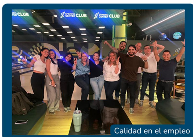
Calidad en el empleo

Conoce las medidas de nuestro catálogo efr , en las dimensiones de: