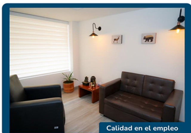
Calidad en el empleo