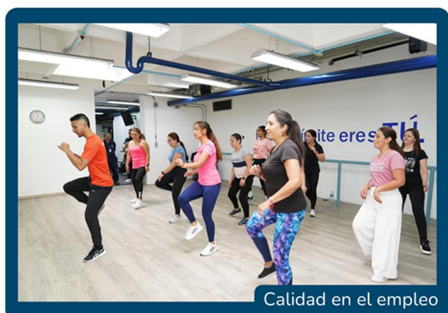
Calidad en el empleo