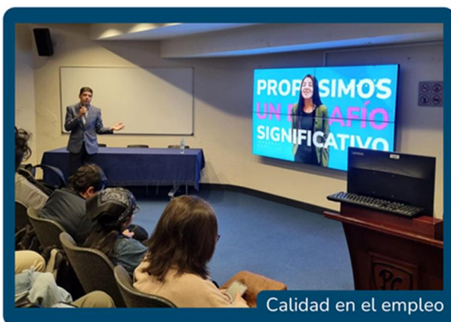
Calidad en el empleo