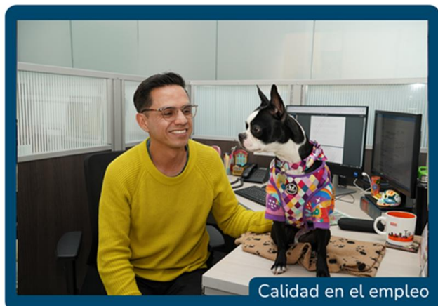
Calidad en el empleo